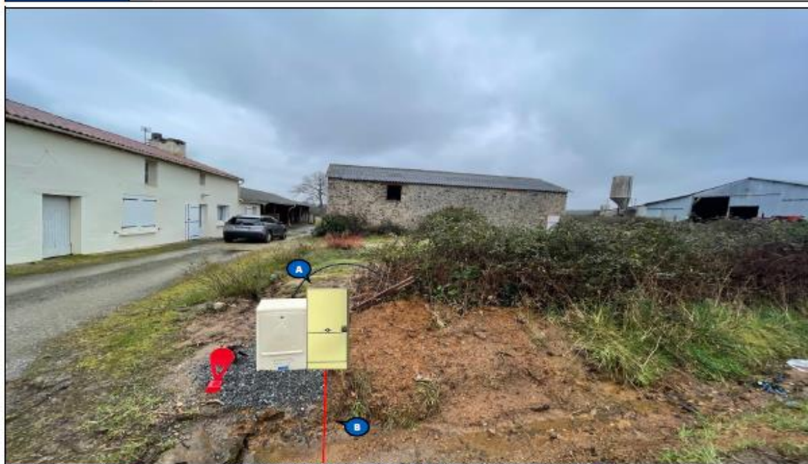
La solution technique est déterminée dans le respect de la norme NF C 15-100 en vigueur. Photo compléer non constructive